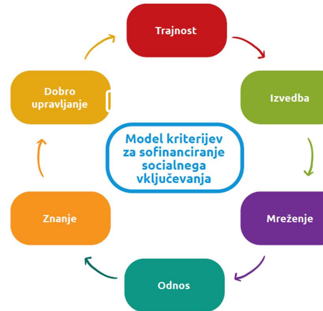
6 MERLJIVIH KRITERIJEV